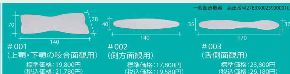
newRef98口腔内撮影用ミラー