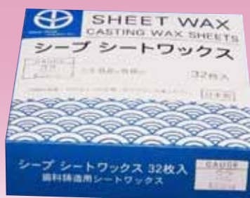
シートワックス32枚入 標準価格：5,100円 (税込価格：5,610円)