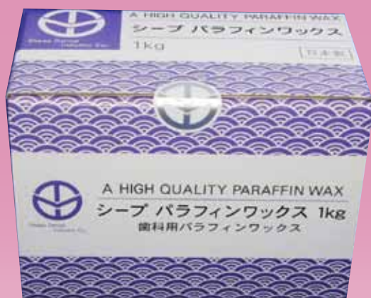
パラフィンワックス1kg入 標準価格：5,500円 (税込価格：6,050円)