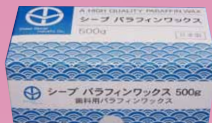
パラフィンワックス500g入 標準価格：3,300円 (税込価格：3,630円)