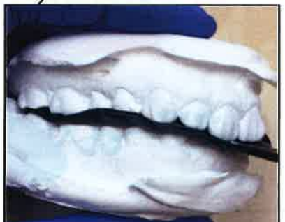
模型に圧接した所